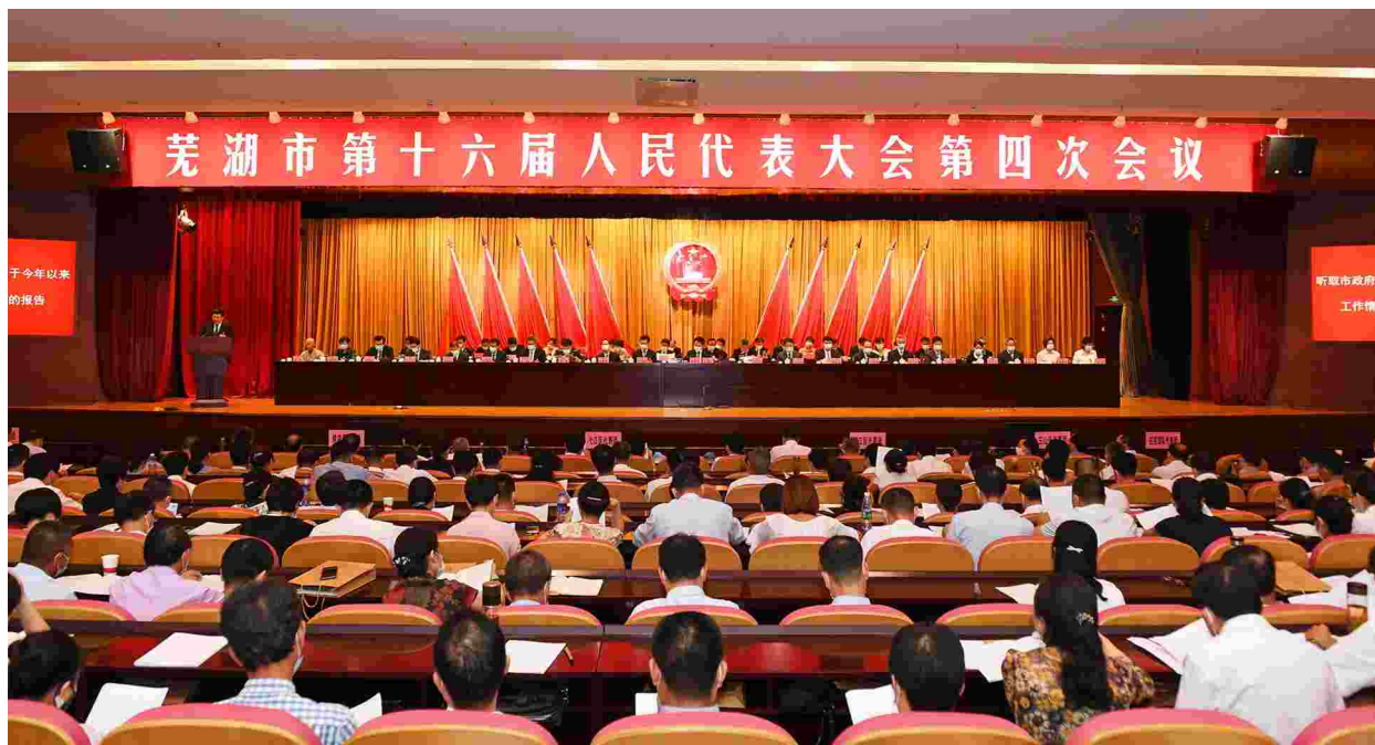
2020年8月26日，芜湖市第十六届人民代表大会第四次会议在芜湖市政务中心召开

【市第十六届人民代表大会第三次会议】 1月7日，市第十六届人民代表大会第三次会议召开。会议议程：1.听取和审议芜湖市人民政府工作报告；2.审查芜湖市2019年国民经济和社会发展计划执行情况与2020年计划草案的报告，批准芜湖市2020年国民经济和社会发展计划；3.审查芜湖市2019年预算执行情况和2020年预算草案的报告，批准2020年市本级预算；4.听取和审议芜湖市人民代表大会常务委员会工作报告；5.听取和审议芜湖市中级人民法院工作报告；6.听取和审议芜湖市人民检察院工作报告；7.选举事项。会议通过了关于芜湖市人民政府工作报告、关于芜湖市2019年国民经济和社会发展计划执行情况与2020年国民经济和社会发展计划、芜湖市2019年预算执行情况和2020