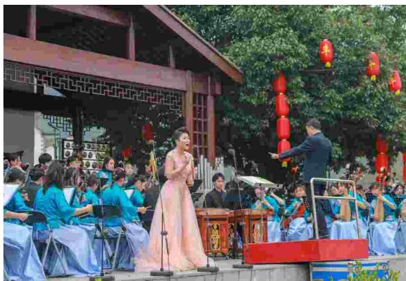
2020年11月1日“决战决胜奔小康”南陵蒿里专场音乐会

用。积极组织第三届长三角文博会和第十六届深圳文博会（云上文博会）参展工作，提升芜湖参展企业的知名度和美誉度。促进文化产业和数字经济深度融合，大力支持凤仪文化、超燃星等公司来芜投资发展，打造特色直播产业示范高地。