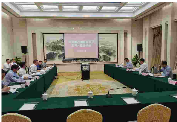
2020年9月23日，省委编办主要领导来芜调研自贸区体制机制工作

【持续推进编制周转池制度改革】 有序推进公立医院编制周转池制度改革，第一批400余名专业技术人员纳入编制管理工作全部完成，第二批500余名专业技术人员纳入编制管理工作正在有序推进，充分发挥了编制在人才汇聚、激励和发展等方面的基础保障作用。完善中小学教职工编制动态调整机制。按照“总量控制、动态调整”的原则，会同市教育局就近三年全市中小学学生数变化情况，教师队伍结构情况开展调研摸底，在全市范围内跨区域、跨学校动态调整教职工编制，优化调整教师结构。