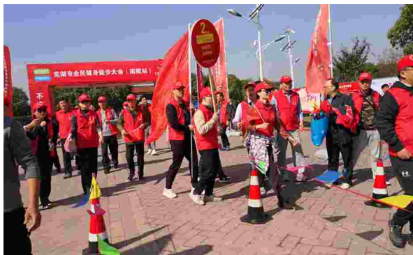
2020年10月24日，市直机关工委组织市直机关党员干部职工参加“不忘初心路、健步新征程”健步行活动

【积极开展机关群众性文体活动】 积极做好机关统战工作。坚持党建带群团工作，加强机关基层工会和妇委会建设，截至10月底市直机关共有基层工会73个，会员5235人。成立妇委会50个，扎实开展“三八红旗手（集体）”“巾帼建功先进个体（标兵）”等的推优工作。在市直机关开展抗疫消费扶贫助力脱贫攻坚行动和“扶企助农 巾帼带货”活动，发放抗疫扶贫消费券157.05万元。落实党内关怀帮扶机制。2020年“两节”期间，积极开展“关爱帮扶送温暖”活动，慰问了41个单位152位干部职工，慰问金额28.45万元。在市直机关建设“母婴室”。举办丰富多彩文体活动。举办“不忘初心路 健步新征程”芜湖市全民健身徒步大会（南陵站）活动，全市140多个部门2200余名干部和群众参与。举办芜湖市直属机关职工“三人制”篮球比赛，市直机关28个代表队200多名职工参加比赛。