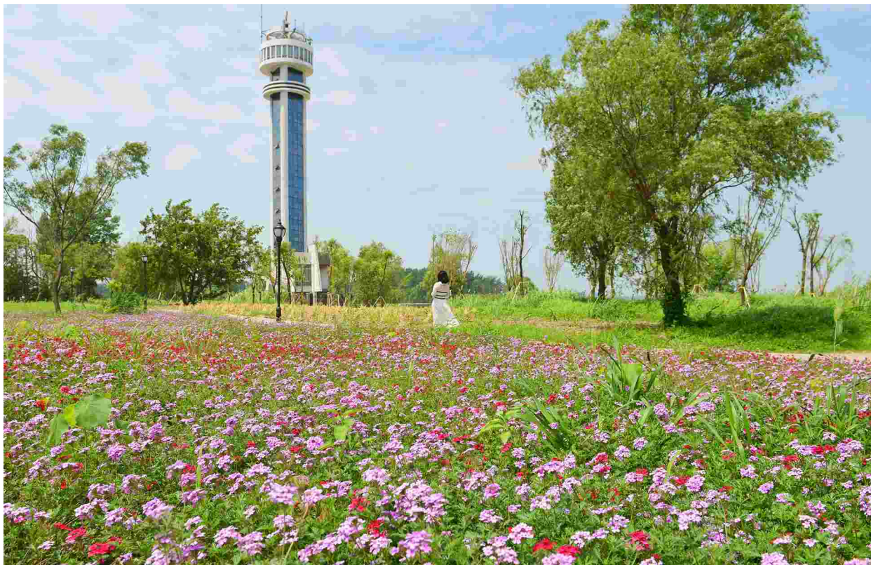
整治后的十里江湾人民公园风景优美，成为市民休闲好去处

服务业发展提质增效。出台促进服务业发展政策及实施细则，完成市级服务业政策兑付资金1.78亿元。获批港口型国家物流枢纽，成为省内唯一国家级物流枢纽。全市快递业务量突破2亿件、增长25%，荣获“中国快递示范城市”称号。推进现代服务业集聚建设，新增省级服务业