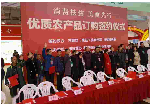
2020年1月芜湖市举办农产品消费扶贫签约仪式

7.9%下降至0%，农村贫困人口收入大幅增加，“两不愁”质量水平明显提升，“三保障”突出问题彻底消除，自主脱贫能力稳步增强，5个结对被帮扶县全面“摘帽”，完成了消除绝对贫困的艰巨任务。