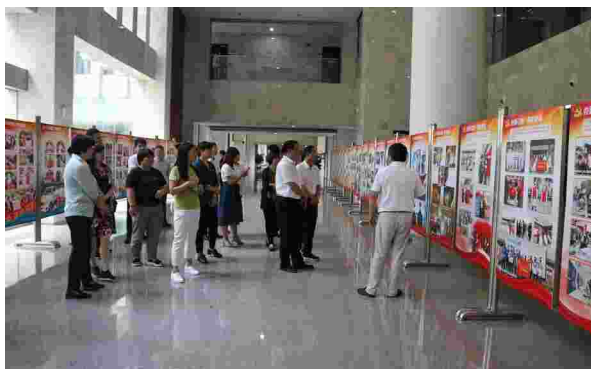
芜湖市档案馆举办“党旗在疫情防控斗争第一线高高飘扬——芜湖市抗击新冠肺炎疫情专题展”

【举办档案专题展】 7月与市委组织部共同举办“党旗在疫情防控斗争第一线高高飘扬——芜湖市抗击新冠肺炎疫情”档案图片展。10月举办“浴血鏖兵——纪念中国人民志愿军抗美援朝出国作战70周年”档案专题展。两次展览累计接待参观4000多人次。