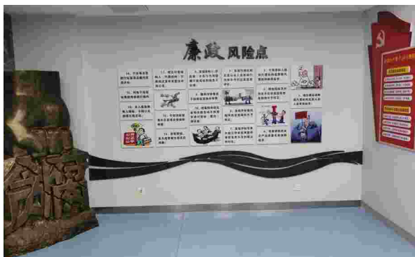
公共资源交易廉政风险警示馆

【市公共资源交易廉政警示馆开馆】 2020年3月13日,市公共资源交易廉政警示馆正式开馆。馆内面积约55平方米,由风险区、耻辱墙、体验区、宣传区四个区域组成。长期以来,芜湖市公管局高度重视具有公共资源交易特色的廉政文化建设,坚持将廉政风险防控贯穿到公共资源交易全过程,切实增强干部职工廉洁自律意识,不断营造风清气正的良好氛围。警示馆开馆以来,共接待市直、区直单位参观人次500余人。