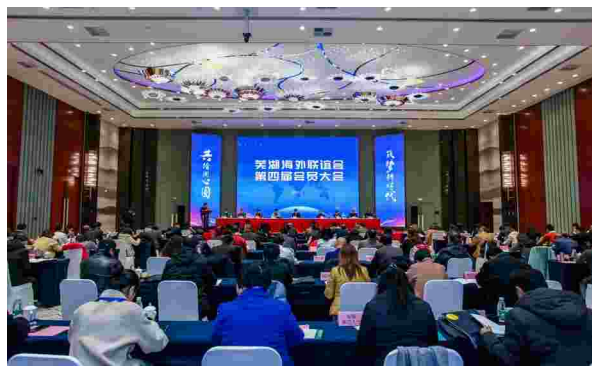
2020年12月10日，芜湖海外联谊会第四次会员大会召开

【芜湖海外联谊会第四届会员大会】 12月10日，芜湖海外联谊会第四届会员大会召开。市委常委、组织部部长、统战部部长杨志斌出席会议。来自加拿大、瑞典、意大利、罗马尼亚等国家和地区的会员，海外顾问代表，县市区、在芜高校、市台联等会员推荐单位相关负责人112人出席会议。市委统战部常务副部长褚云凤作《芜湖海外联谊会第三届理事会工作报告》，市委统战部副部长、市侨办主任陈玉红作《第四届会员大会人事安排说明》。会上审议通过了《芜湖海外联谊会章程修正案》，选举产生芜湖海外联谊会第四届理事会理事，选举杨志斌为第四届理事会会长，通过了名誉会长及海外顾问人选名单。