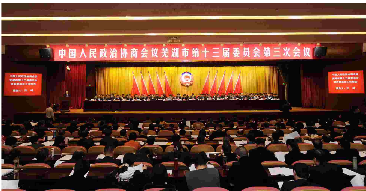
2020年1月6日至9日,中国人民政治协商会议芜湖市第十三届委员会第三次会议在市政务文化中心举行

【创新提案工作机制】 邀请市直单位分经济、城建、民生3个专场向委员通报情况,为委员撰写高质量提案打下坚实基础。制定《开展全案对口联系工作办法》,修订《重点提案遴选与督办办法》《提案工作细则》,将全部提案按职能归口到各专委会,57件重点提案提请市委市政府主要负责同志、市政协主席会议成员、专委会负责同志及提案委成员具体督办,形成领导示范带动、提案委谋划调度、专委会各尽其责的提案办理新机制,全年立案交办提案364件,办复率100%。评选20件优秀提案、10个提案工作先进