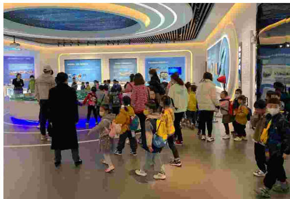
2020年7月16日芜湖市产业创新馆正式对公众开放