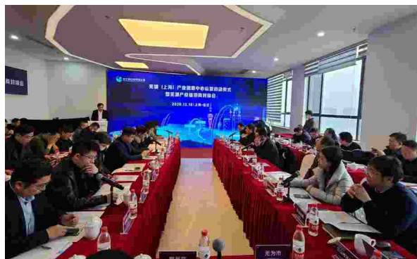
2020年12月18日，芜湖（上海）产业创新中心运营启动仪式暨产业链招商对接会

【长三角G60科创走廊芜湖产业创新中心运营启动仪式暨产业链招商对接会成功举行】 12月18日，长三角G60科创走廊芜湖产业创新中心运营启动仪式暨芜湖产业链招商对接会在上海市松江区举行。这标志着安徽省内城市中首个在上海购置土地自主建设的“创新飞地”正式开始运营。中心创新性地通过政府搭建平台，由芜湖市政府在松江区购置土地，组建运营公司建设园区，加快打造“孵化在上海，产业化在芜湖；研发在上海，生产在芜湖；前台在上海，后台在芜湖”的两地协同创新模式，推动长三角先进制造业一体化发展，帮助芜湖的制造业及实体经济与上海的科技和人才软实力充分嫁接，推动两地产业合作、协同发展。首批八家企业入驻。活动邀请了上海交通大学、同济大学、东华大学三家高校代表开展产业链对接，举行了入驻企业签约仪式。25家企业代表参加了产业链招商对接会，无为市、繁昌区、三山经济开发区等载体单位参会。