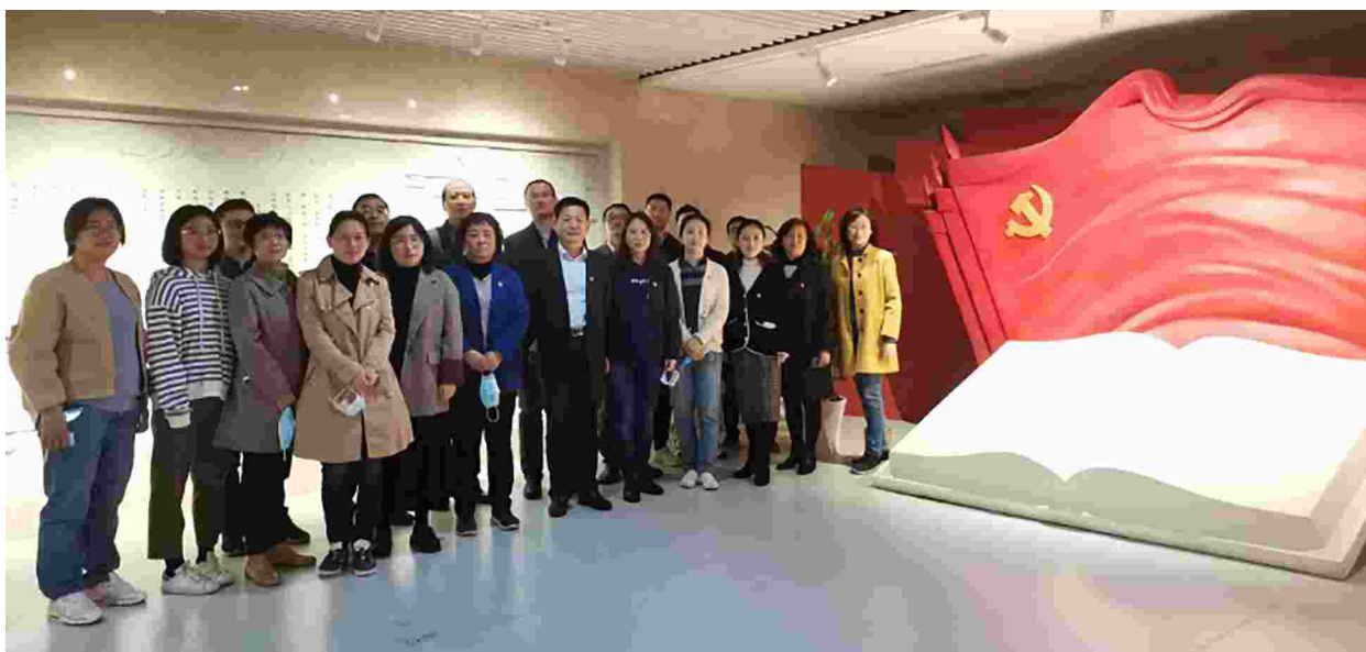
市政府办公室组织党员干部赴市反腐倡廉教育馆开展党风廉政教育

会前学习：习近平总书记在统筹推进新冠肺炎疫情防控和经济社会发展工作部署会议上的讲话