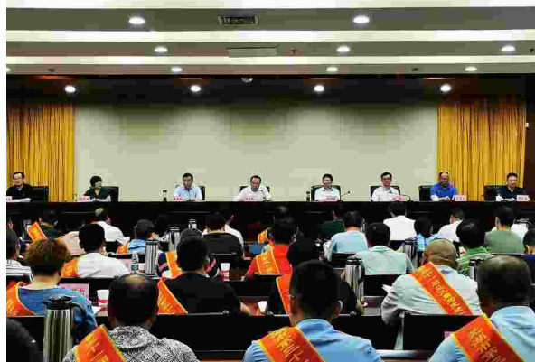
2020年9月11日，芜湖市召开第31届见义勇为先进个人表彰大会