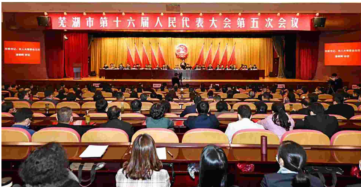
芜湖市第十六届人民代表大会第五次会议

“沧海横流，方显英雄本色。”疫情发生以来，我们坚决打赢疫情防控人民战争、总体战、阻击战。全市34例确诊病例全部治愈出院，确诊患者治愈率、境外输入管控率均为100%，未发生一起聚集性疫情，十万人发病率、“四转”等9项指标均居全省前列。2020年汛期，芜湖市经历了历史罕见的特大洪水袭击，累计降水量超过历史极值，长江水位超历史第二高位。我们坚持“以防为主，防抗救相结合”的思路，有效发挥近年来新建的重大水利设施作用，投入资金5.9亿元、查险人员150万人次，日夜奋战，转移安置受灾群众8.4万人，实现了确保人民群众生命安全、确保城区（县城）和重要基础设施不淹、确保万亩以上圩口不破的目标，夺取了防汛抗洪抢险救灾斗争全面胜利。灾后重建“四启动